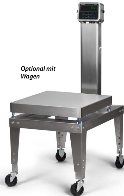
Optional mit Wagen