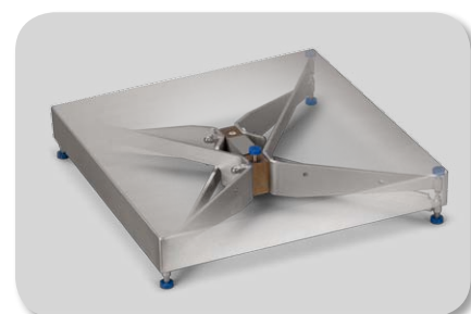
Ausführung der Plattform