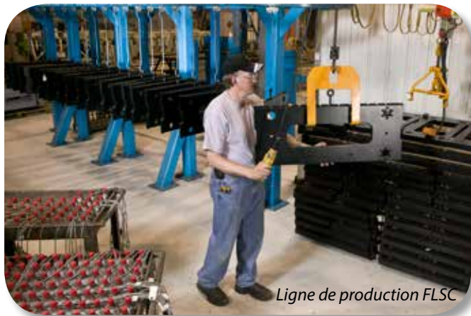
Ligne de production FLSC

Kit chariot balance sans fil FLW 100 (batterie chariot, transmetteur chariot, récepteur instrument, chargeur batterie)