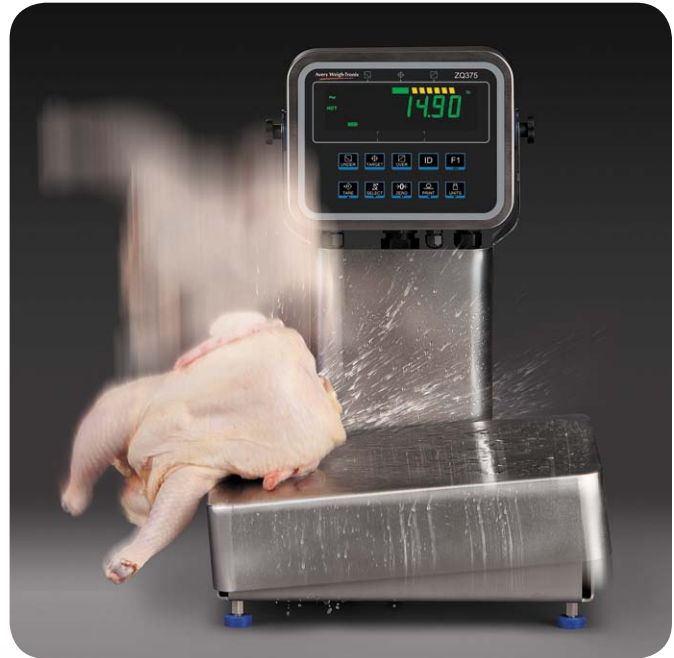
Torsion Base con protección contra cargas de choque de 500%

Soporta cargas de choque de hasta un 500%, nuestro sistema de transferencia de carga de separación garantiza la precisión y fiabilidad en todo momento. Esta base especializada transfiere de manera automática las cargas de choque y las sobrecargas de la celda de carga hasta el marco de la base, para que la precisión y el rendimiento de la báscula no se vean afectados. A diferencia de otros diseños que se usan para reducir la carga de choque, este diseño de acero inoxidable para alimentos ofrece una solución limpia y sin complicaciones que está completamente certificada por NSF y es resistente al lavado.