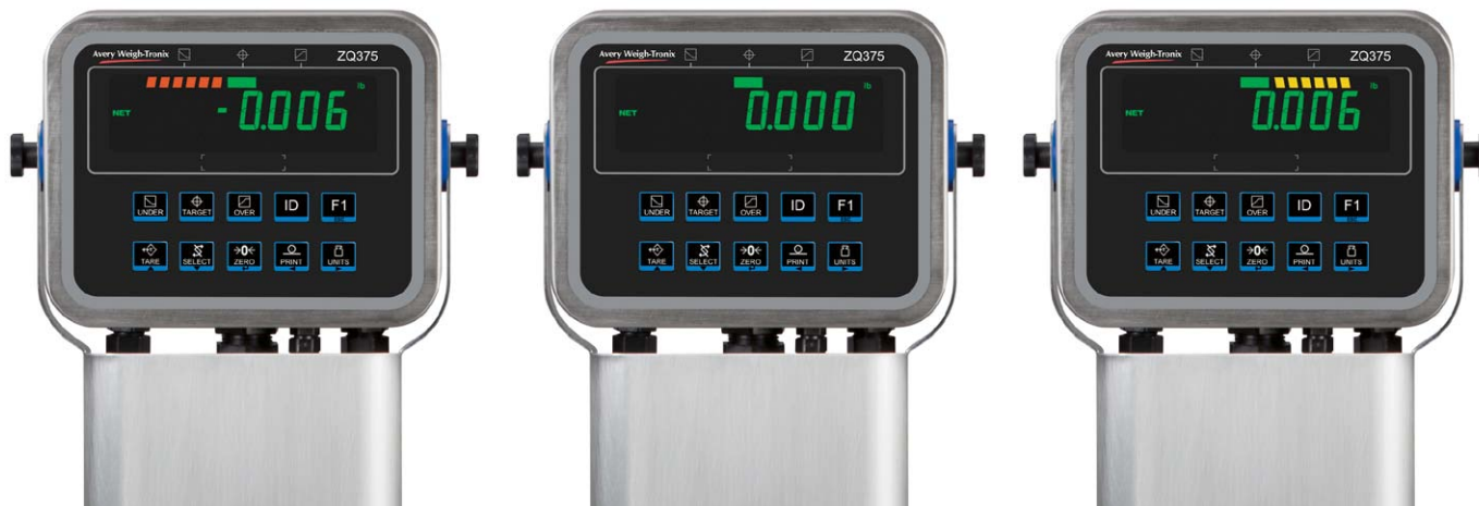
Gráfico con varios segmentos que muestra peso bajo, peso objetivo y sobrepeso.

El registro de diseño de la serie de productos ZQ375 está pendiente de patente en Estados Unidos.