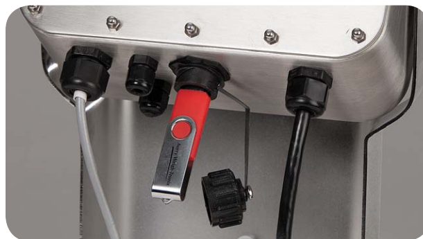
USB con conector impermeable opcional