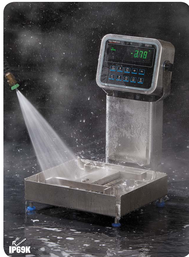
Cubierta de la base fácil de quitar para la limpieza profunda

Sabemos que una buena higiene es vital para el éxito del negocio en la industria alimenticia. En cumplimiento con USDA y otras normas de limpieza e higiene, esta pieza certificada por NSF garantiza la higiene en todo momento. El modelo ZQ375 se ha diseñado para facilitar la limpieza. Un acabado de superficie pulido, con baño desoxidante, ayuda a detener el crecimiento de los microorganismos en la superficie de la báscula. Las esquinas redondeadas y la cubierta fácil de retirar hacen que la limpieza profunda sea sencilla, rápida y efectiva, minimizando las áreas de acumulación de comida donde puedan proliferar las bacterias. Todas las roscas están cubiertas higiénicamente con tuercas abovedadas para ayudar y agilizar los procesos de limpieza.