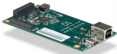
Tarjeta de dispositivo USB Proporciona interconexión USB con el equipo.