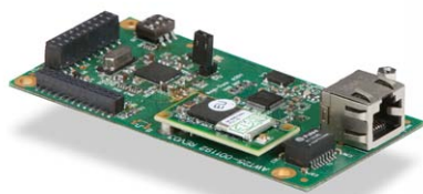
Kit de tarjeta inalámbrica y antena Inalámbrica 802.11b/g