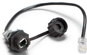
Conector hermético Ethernet o USB